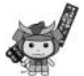
ひょうたん山夢街道ま つりマスコットキャラ クター「ひがちゅう」

☎ ☎ ▷ひょうたん山夢街道まつり実 行委員会事務局 070(6425)3133 ▷市民協働室 06(4309)3319、FAX06 (4309)3812