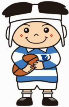
ラグビーのまち東大阪 マスコットキャラクター 「トライくん」