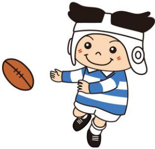
ラグビーのまち東大阪 マスコットキャラクター 「トライくん」