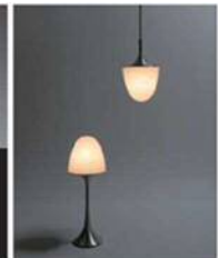
株式会社盛光SCM 照明ALED