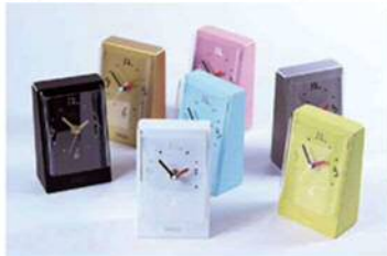
株式会社オークマ工業 時計 SPAZIOシリーズ