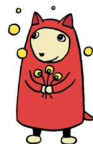
クーちゃん (相談員キャラクター)