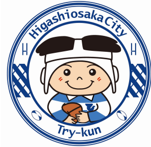
東大阪市マスコットキャラクター 「トライくん」