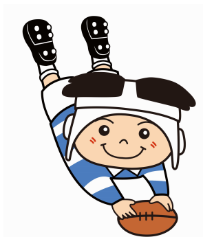
ラグビーのまち東大阪 マスコットキャラクター 「トライくん」