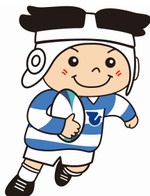
ラグビーのまち東大阪 マスコットキャラクター 「トライくん」