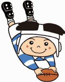
ラグビーのまち東大阪 マスコットキャラクター 「トライくん」