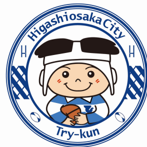
東大阪市マスコットキャラクター 「トライくん」