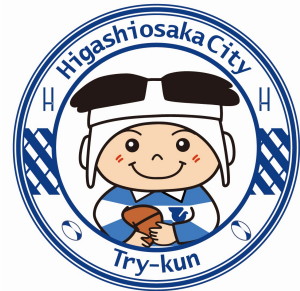
東大阪市マスコットキャラクター 「トライくん」