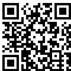
近畿管区行政評価局 ホームページ

詳しくは、近畿管区行政評価局のホームページや行政相談委員オフィシャルウェブサイトをご覧ください。