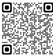
行政相談委員 オフィシャルウェブサイト