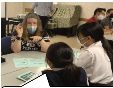
ALTに自分の得意なことを伝えよう