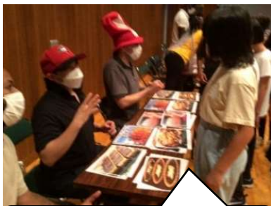
外国のフードコートで買い物しよう